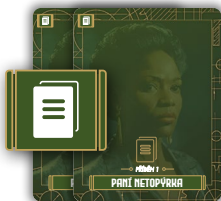
2 karty příběhu