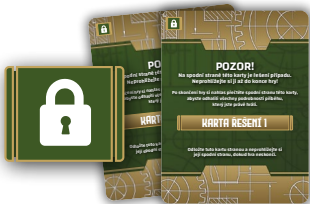
2 karty řešení