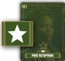
1 karta cílů

Poté nezapomeňte odložit stranou posledních 5 karet z balíčku . 2 karty úvodu si přečtete těsně před zahájením hry (viz část Přečtete si úvod , strana 7). 2 karty řešení ponechejte položeny lícem dolů na stole a neprohlížejte si je až do konce hry. Na poslední kartě v balíčku naleznete přehled pravidel – mějte jej při hře po ruce.