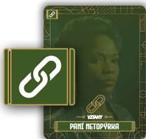
1 karta vztahů